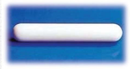
Stirring Bars (Cylindrical)