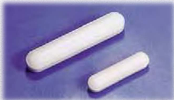
Stirring Bars (Plain Economy)