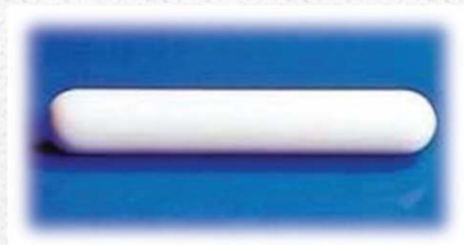
Stirring Bars (Cylindrical)